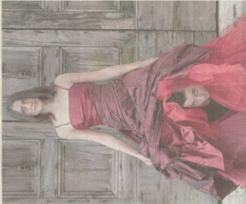
A Sanpolino dall'11 ottobre una rivisitazione dell'Antigone di Sofocle

Ancora di Spazio Aità è «La lepre» (venerdì 6 e domenica 8 dicembre), un libero adattamento di scritti e poesie di